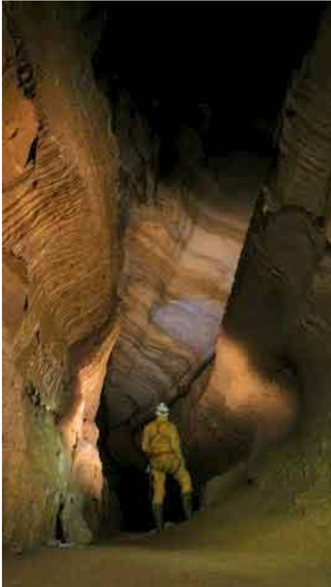
Sublime galerie du métro à la grotte de La Malatière à Bournois (25)